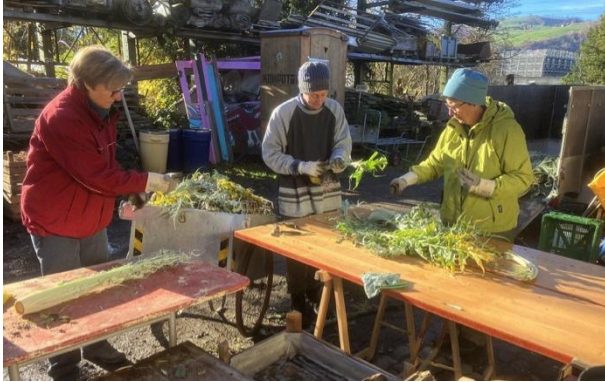
Mitglieder rüsten die stachelige Kardy.