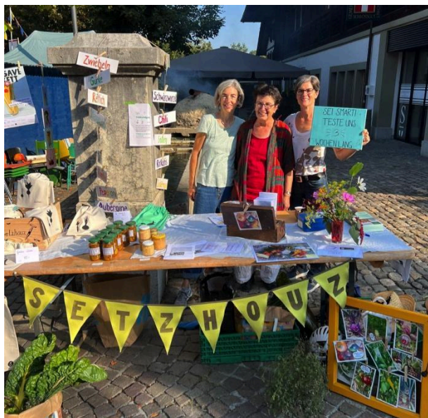
Die AG Marketing in Aktion am Herbstfest.

Ebenfalls nahmen wir an Anlässen unserer wichtigsten Kooperationspartnerin, der ÖkoGärtnerei Maurer, teil, namentlich bei der Saisonöffnung im April und den Kräutertagen im August. Wir beteiligten uns zudem an drei Veranstaltungen der Gemeinde Münsingen: Am Neuzuzüger:innen-Anlass boten wir eine Setzhoz-Führung an. Für «Münsingen bewegt» organisierten wir ein Garten-Fitness. Am Eröffnungsfest der Entlastungsstrasse waren wir mit einem Essensangebot, einem Wettbewerb und einem Feldrundgang dabei.