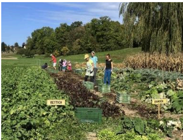
Ernte auf dem Setzhoz-Acker.

Unsere zwei Occasionstunnel von 4 mal 30 Metern haben uns den Anbau von Sommergemüse wie Tomaten, Gurken, Peperoni und Auberginen in ansprechender Menge ermöglicht. Über den Winter beherbergen sie Nüsslisalat und Krautstiele. Die Tunnels müssen wir halbjährlich versetzen. So können wir auf immer wieder frischem, nicht abgedecktem Land verschiedene Gemüse geschützt anbauen.