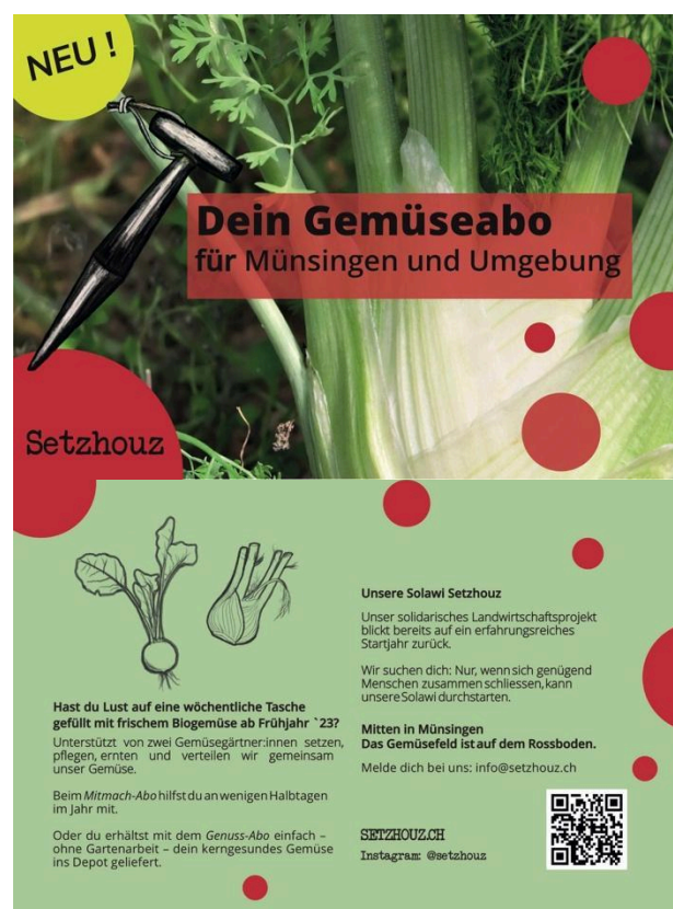
A5-Flyer (Vorder- und Rückseite)