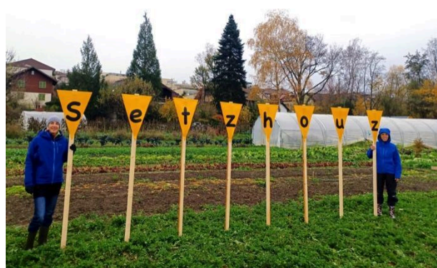
Die Fähnlein sind von Weitem sichtbar.