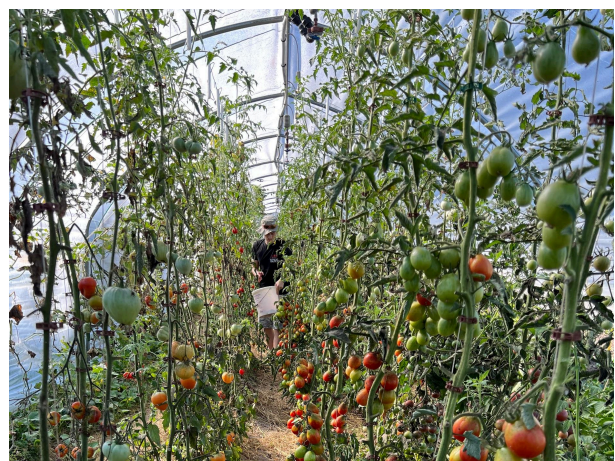
Riesige Tomatenvielfalt im Folientunnel.