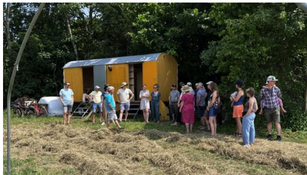
Die Mitglieder besichtigen den Bauwagen.

Das Mitte Oktober geplante Erntedankfest mussten wir wegen schlechter Witterung leider absagen. Ein Dankesritual für das erfolgreiche erste Setzhouz-Jahr auf dem Rossboden konnten wir am 27. Dezember bei unserem Jahresabschlussfest nachholen.