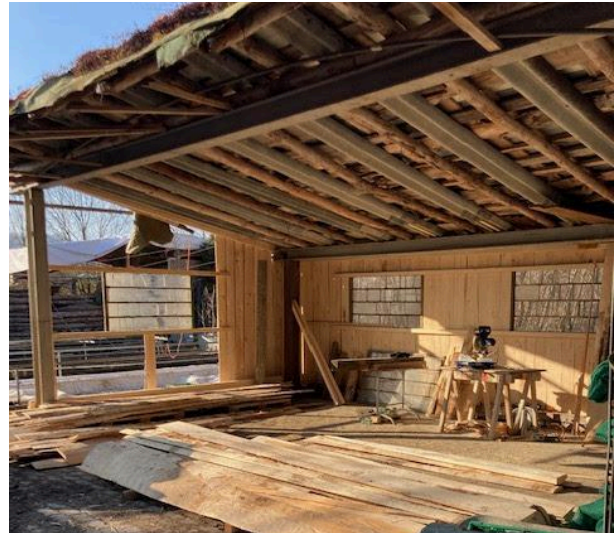
Der Schuppen erhält einen neuen Boden