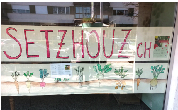
Farbenfrohe Werbung im Schaufenster.

Im Frühling konnten wir das Schaufenster des leerstehenden Ladenlokals an der Bernstrasse 17 für unsere Werbung nutzen. Seit Herbst ist unser Garten mit Fähnlein beschriftet, die auch von der Zugstrecke Bern-Thun aus gut sichtbar sind.