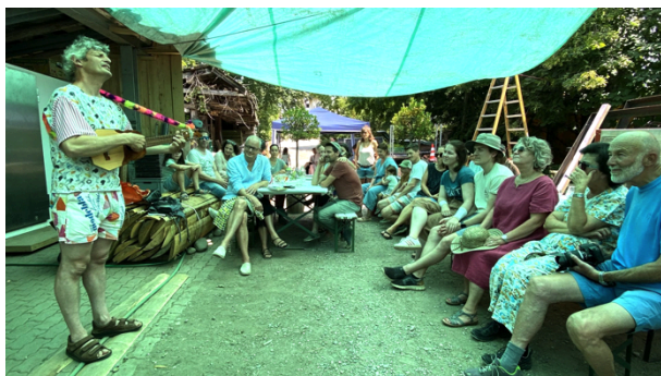
Marbach besingt den Schnittlauch.