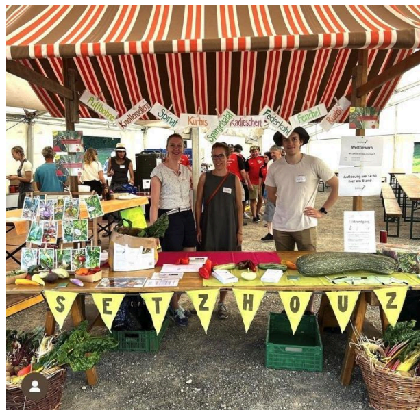
Stand am Fest für die Entlastungsstrasse.